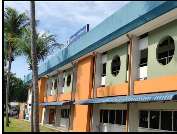
Gambar 5: Bangunan Perpustakaan Cendekiawan UiTM Cawangan Terengganu